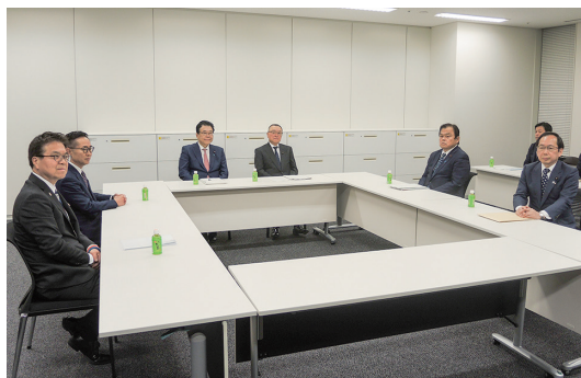
税制調査会での三党合意には至らず

だ。一方、国民民主党側は、一刻も早い廃止を主張。令和8年度税制改正議論の前に廃止するよう引き続き求めていくとしている。